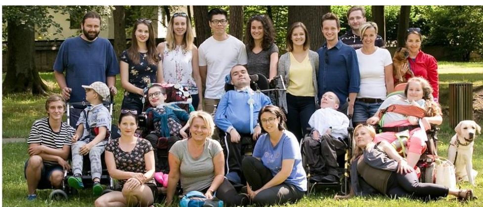
Krásná vzpomínka na 3. Letní odlehčovací pobyt 2019, DUPV – Dech života děkuje organizaci Život dětem, Nadaci Agrofert, Karlínskému spolku pro zábavu, firmám Chiesi CZ s.r.o. a Strojírny Olšovec a městu Ostrava za jejich finanční příspěvky! Pomáháte nám plnit sny!

V roce 2019 se v termínu 10.-17.8.2019 uskutečnil již 3. ročník našeho pilotního projektu „Letní odlehčovací pobyt pro pacienty na DUPV“. Tentokrát jsme s našimi pacienty zamířili do chaty Bílá v Beskydech. Program byl nabitý literárními aktivitami, poznáváním okolí i dramatickou výchovou. Pacienti tak mohli zapojit svou fantazii na maximum a věřte, že vznikaly opravdu skvostné výtvary. Pro velký úspěch se tomuto tématu budeme věnovat i v následujícím ročníku. Pobytu se zúčastnilo 8 pacientů a doprovodný tým zdravotnických sester a asistentů. Zajistili jsme je pro pacienty zajistili zcela zdarma, a to díky finanční pomoci několika velmi významných organizací, firem a soukromých dárců. Přijměte tímto náš velký dík!